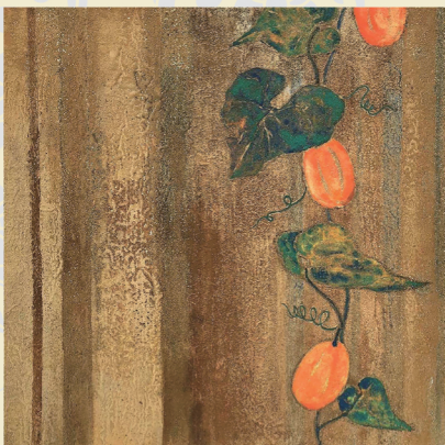
新井淑子 《戸板に掛かる烏瓜》