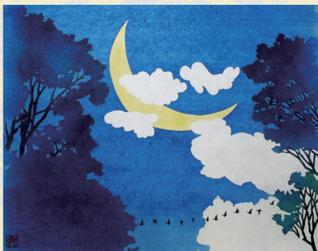
伊砂正幸 《万葉集シリーズより「雁が音」》