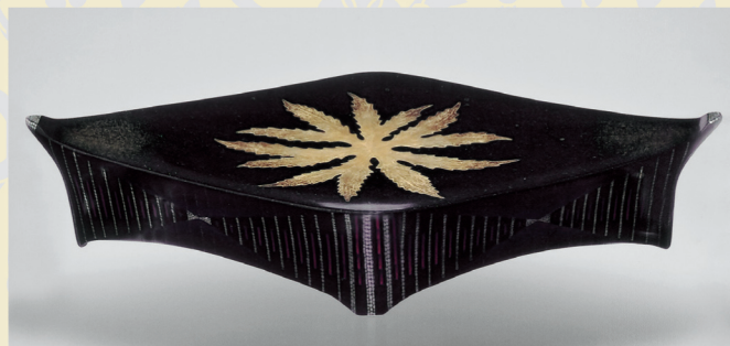
山田豊子(三代楽全) 《乾漆 燗祭器》