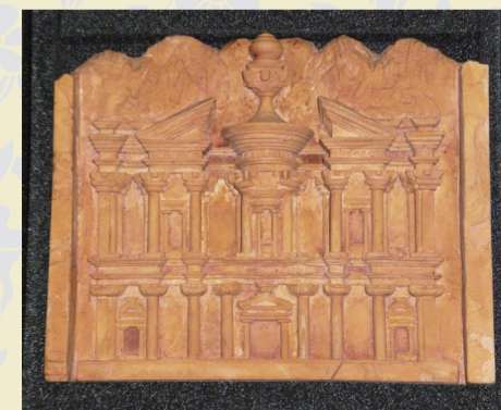
ヨルダン・ハシェミット王国 《ペトラの遺跡の岩の彫刻》